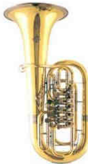
Instrumento con cilindros