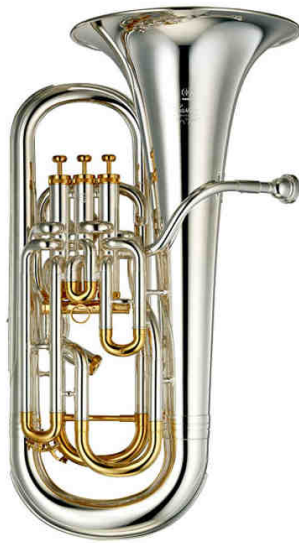
Instrumento con pistones

Afinado en sib, su tesitura y similitud con el trombón lo hace muy cercano a éste, más aún si pensamos en el trombón de pistones. Suele fabricarse en dos diseños bien distintos, los que llevan cilindros tienen la campana apuntando hacia la izquierda del músico, mientras que los que emplean pistones están orientados hacia la derecha del instrumentista; éstos últimos son los más comunes. El color final del instrumento no es demasiado determinante con respecto a otros criterios de fabricación.