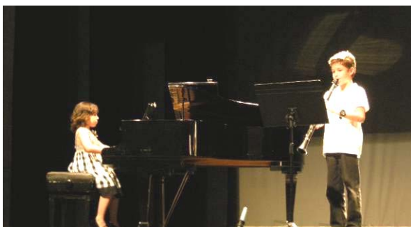
Dúo Clte-Piano “UMA”.

(1er Premio E.E. en el concurso de Valverde y en el de Nerva celebrado el día antes)