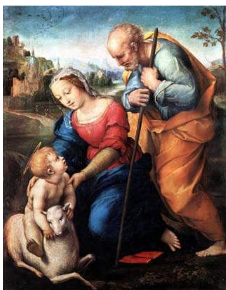
Sagrada Familia del Cordero, de Rafael Sanzio

El término "villancico" deriva de "villanos" dada a los habitantes de las villas, es decir, de los pueblos y ciudades para diferenciarlos de los nobles y de los clérigos, eran por así decir el pueblo llano. Las composiciones basadas en la Navidad tienen un origen muy antiguo. Entre los más antiguos que se conservan tenemos: " Veni redemptor gens ", himno atribuido a San Ambrosio de Milán (340-397) y " Jesus refulsit omnium ", atribuida a San Hilario de Poitiers (Siglo IV). Del siglo siguiente es " Corde natus ex Parentis ", basado en textos del poeta hispano-latino Prudencio. " Puer Natus Est Nobis " es un canto gregoriano del siglo VI que se cantaba en la liturgia navideña. Los primeros villancicos tenían un ritmo musical muy llano, más tarde se introdujeron diversas melodías y comenzaron a agregarse instrumentos.