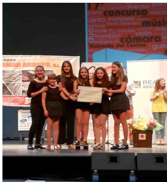
“Saxteto”: Sexteto de Saxofones

“La verdadera belleza de la música es que conecta gente. Lleva un mensaje y nosotros, los músicos, somos los mensajeros”.-Roy Ayers