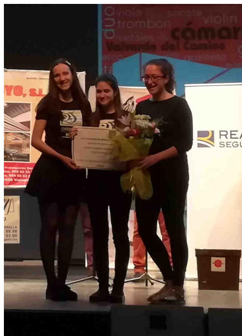
Cuarteto de Guitarras “COLOR” 1er Premio de Enseñanzas Profesionales (3 componentes del citado grupo)